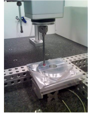
Pezzo di Prova e macchina di misura a coordinate (CMM)

Se si vuole valutare solo la qualità generale della macchina è necessario realizzare 20 repliche del pezzo descritto nel disegno riportato sopra, in condizioni di normale operatività della macchina utensile. Anche in questo caso i pezzi verranno misurati mediante macchina di misura a coordinate (CMM) ed i valori ottenuti consentiranno di calcolare l'indice di capacità che, essendo basato su un pezzo standard definito dalla normativa UNI ISO 10791-7:1998, rappresenta un buon indicatore della qualità generale della macchina.